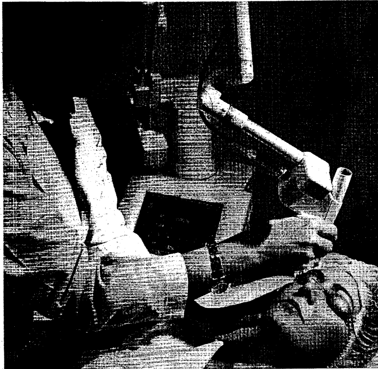
Una paciente, durante una intervención de cirugía estética.

La segunda intervención más demandada es la liposucción, y una de las de mayor riesgo, por la movilización de grasas.